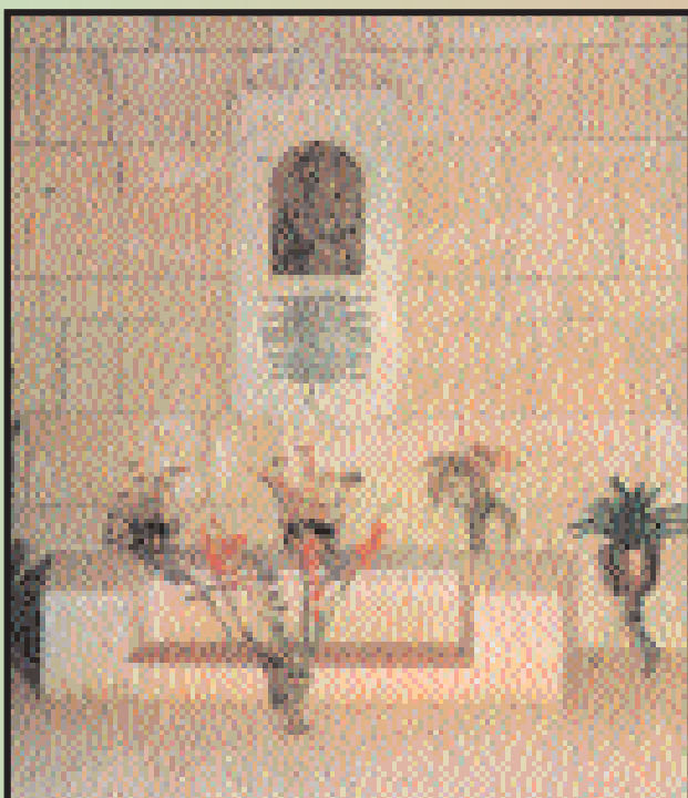
Tomba di Fra Gesualdo all'interno della Basilica dell'Eremo

All'atto della Sua designazione a Ministro Provinciale aveva predetto : " non terminerò il triennio del mio provincialato ". Il 22 dicembre del 1896, alla presenza dell'Arcivescovo Card. Gennaro Portanova e delle massime autorità Civili e religiose furono raccolti i suoi resti mortali e ricomposti in un'urna di zinco e sistemati nello stesso posto.